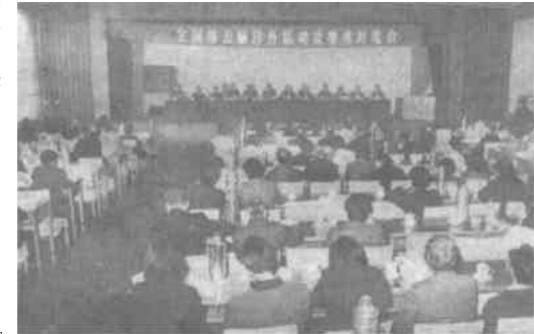
图为大会会场。