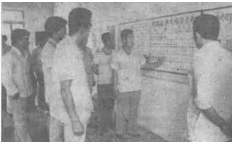
利津县明集乡党委、政府形势教育抓得紧、抓得活，每逢乡驻地集市，就把14块宣传板挂出来，向群众宣讲几年来改革开放给本乡带来的巨大变化。到目前已接待参观群众累计达3万人次。

他们仅仅是感激生活上有了依靠吗？汽修车间一个20来岁满手油污的小伙子道出了心里话：“做为一个残疾人，吃救济似乎成了天经地义的事。可那时候总觉得矮人一头。可现在不